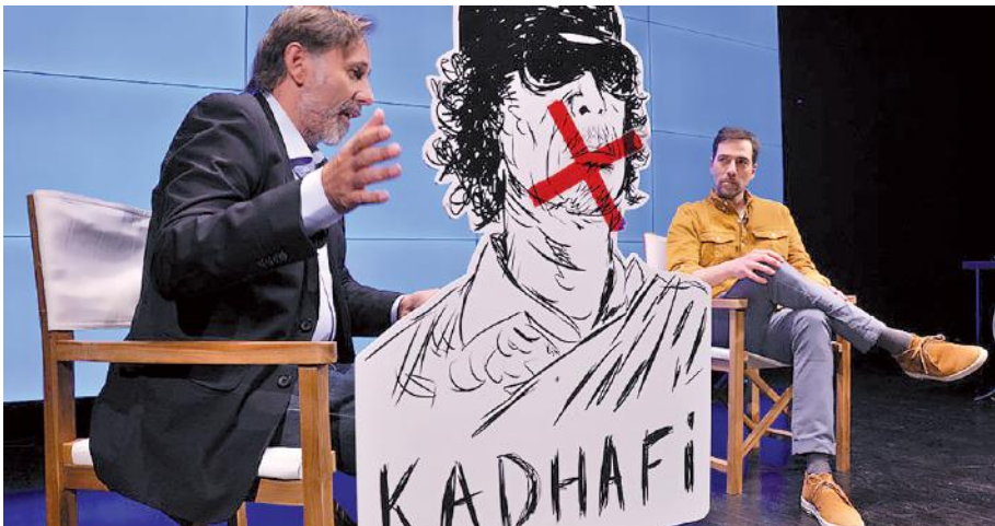
L'homme qui tua Mouammar Kadhafi

La 1 re édition de ce nouveau festival a été diluée sur la saison précédente. La 2 e a eu lieu cet automne. La 3 e et les éditions prochaines se tiendront à la sortie de l'hiver, au moment où les esprits en hibernation se réveillent, où le besoin d'assouvir notre curiosité est au plus haut ! Notre but, continuer de vous faire découvrir des œuvres qui chatouillent notre vision du réel, qui nous éveillent, nous secouent, nous remuent. Des spectacles autour des écritures du réel, qui nous permettent de poser un regard différent sur des sujets d'actualité, des faits historiques, des témoignages enfouis, des histoires marquantes du quotidien... Nous souhaitons créer un espace où s'entrecroisent art et société, et où chacun et chacune puissent partager leurs interrogations sur le monde en devenir. La nouveauté de cette 3 e édition : l'arrivée d'une thématique. Une thématique qui nous permettra d'approfondir certains sujets, de confronter les points de vue et de proposer des débats. Au regard de l'actualité, nous n'avons pas pu nous empêcher de traiter de politique. Comment faire démocratie ? Par qui et comment sommes-nous influencés ? Qu'est-ce qui guide nos choix ? Y a-t-il un bon choix ?